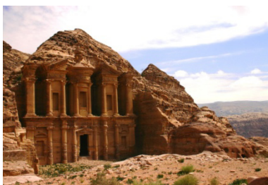
Ad-Dayr ibodatxonasi va tosh sardoba.