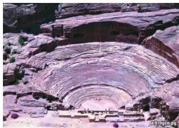
Toshda o'yib barpo etilgan amfiteatr.

Shahar yirik qoyatoshlardan barpo etilgani bois, ba'zi tadqiqotchilar Petraning bunyod etilishida ulkan ehromlarni qurgan misrliklarning qo'li bor, degan fikrni oldinga suradilar. Ammo, Petrada olib borilgan tadqiqotlar shaharning qurilishiga misrliklarning aloqasi yo'qligini ko'rsatdi. Ushbu shaharni qadimgi misrliklarga o'xshash me'morchilikning yuksak cho'qqilarini egallagan boshqa xalq — nabataylar bunyod etishgan.